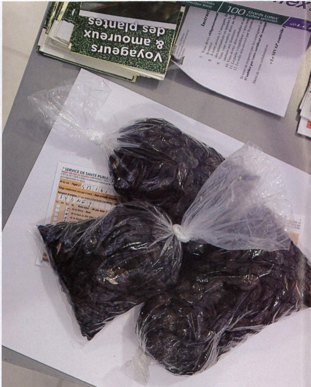
Saisie de sachets de graines encore vertes à l'intérieur qui ont un fort pouvoir germinatif.