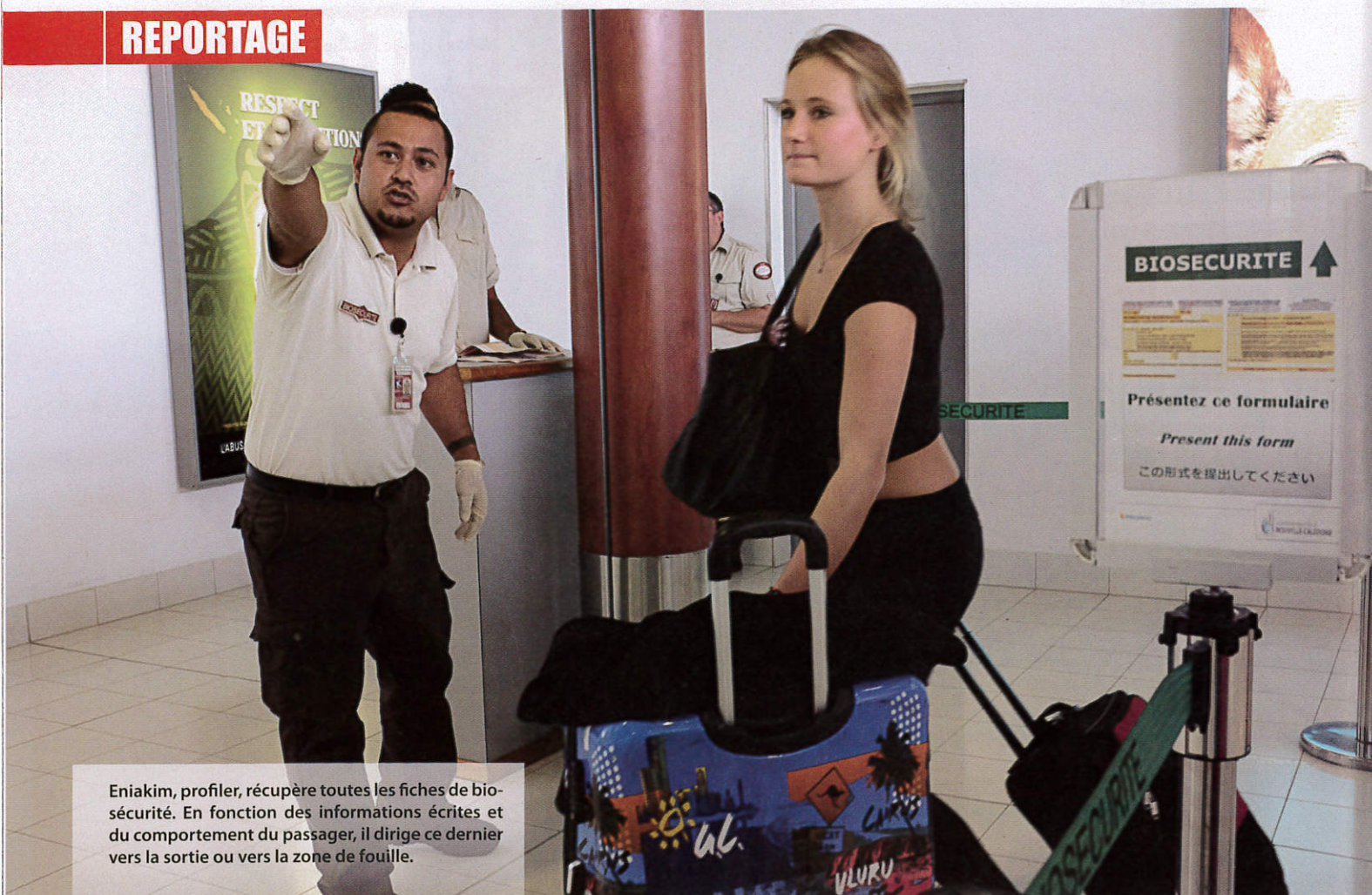
Eniakim, profiler, récupère toutes les fiches de bio-sécurité. En fonction des informations écrites et du comportement du passager, il dirige ce dernier vers la sortie ou vers la zone de fouille.