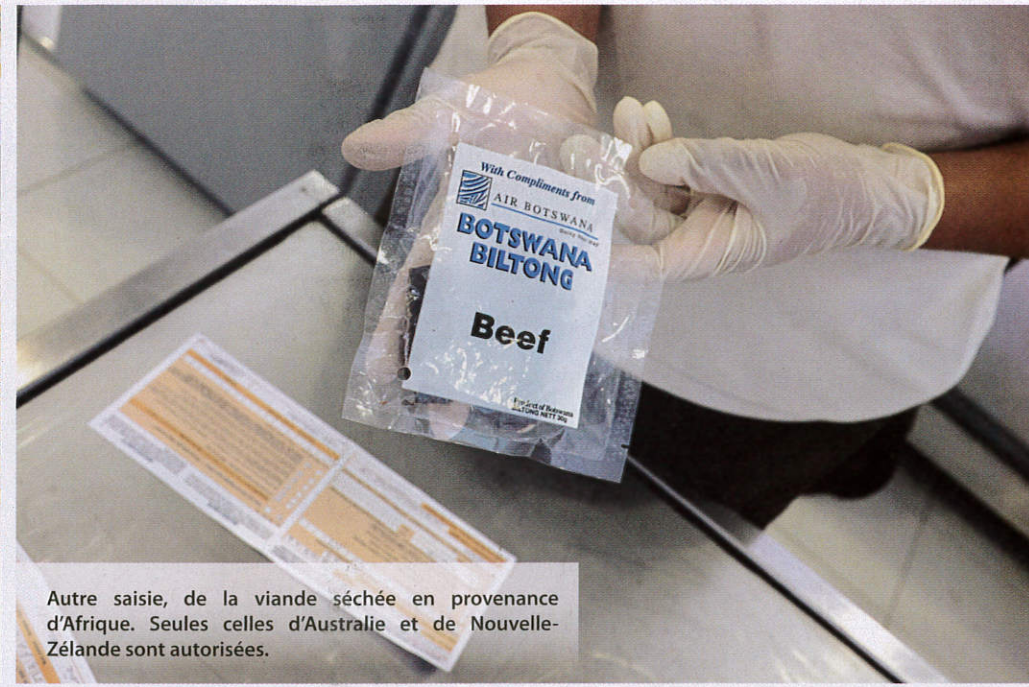
Autre saisie, de la viande séchée en provenance d'Afrique. Seules celles d'Australie et de Nouvelle-Zélande sont autorisées.