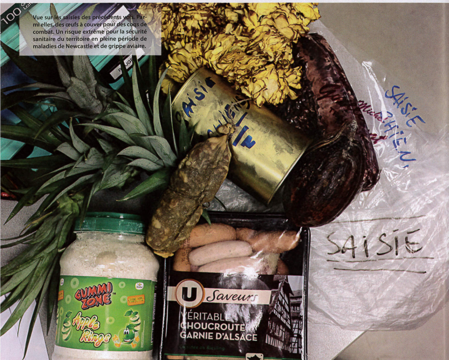
Vue sur les saisies des précédents vols. Parmi elles, des œufs à couvrir pour des coqs de combat. Un risque extrême pour la sécurité sanitaire du territoire en pleine période de maladies de Newcastle et de grippe aviaire.

... per les produits alimentaires cuits ou les fleurs de tiaré, à l'époque autorisées. Une fois chez eux, ces personnes devaient jeter ces feuilles au pied des bananiers de leur jardin pour qu'elles se décomposent. » Les transmissions peuvent aussi se faire par voie naturelle comme la rouille des myrtacées, arrivée sur le territoire par le vent.