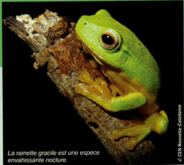
La rainette gracile est une espèce envahissante nocturne.