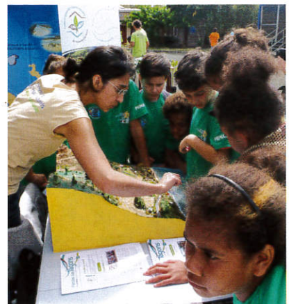
Des animations autour du bien inscrit au patrimoine de l'Unesco sont proposées aux scolaires.

Un appel a également été lancé aux enseignants pour prendre part aux comités de gestion qui existent dans différentes communes. « Les comités de gestion manquent de jeunes, et de femmes ! » ont expliqué les deux responsables. ■